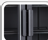
Maniglia esterna in alluminio